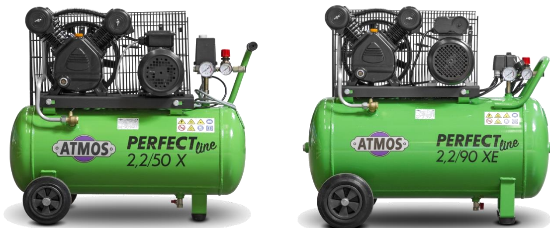
Foto: pístový kompresor Perfect line 2,2/50 X a Perfect line 2,2/90 XE

Technické změny vyhrazeny bez předchozího upozornění!